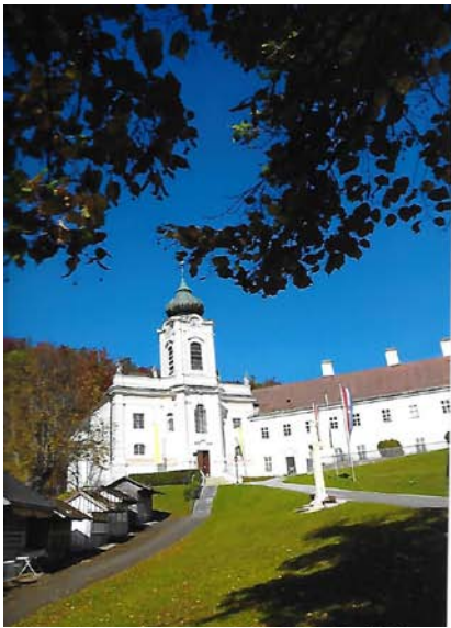
Eines der Ziele rund um den Schneeberg war der Mariahilfberg.

In strahlendes Sonnenlicht gebadete goldfarbene Wälder, die Schönheit der Landschaft im Piestingtal und Höllental: Das war der Rahmen unseres Herbstausflugs am 16. Oktober in die Welt von Raimund und Gauermann.