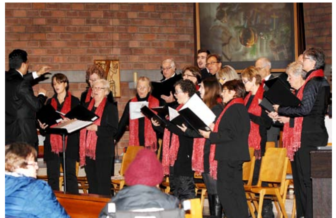
Der Chor Anger Vokal beim vorjährigen Weihnachtskonzert.

W enn man am Donnerstag zwischen 18 und 20 Uhr ins Pfarrzentrum am Kagraner Anger kommt, hört man aus den Räumlichkeiten des ehemaligen Bildungszentrums Klänge von altbekannten Weihnachtsliedern wie „Fröhliche Weihnacht“ bis zu einer neuen Version von „The Little Drummer Boy“. Ja, es wird eifrig für das bevorstehende Weihnachtskonzert geprobt.