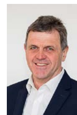
Andreas Pascher Mitarbeit: Caritas, Vermögens- verwaltungsrat Recht braucht Gerechtigkeit.