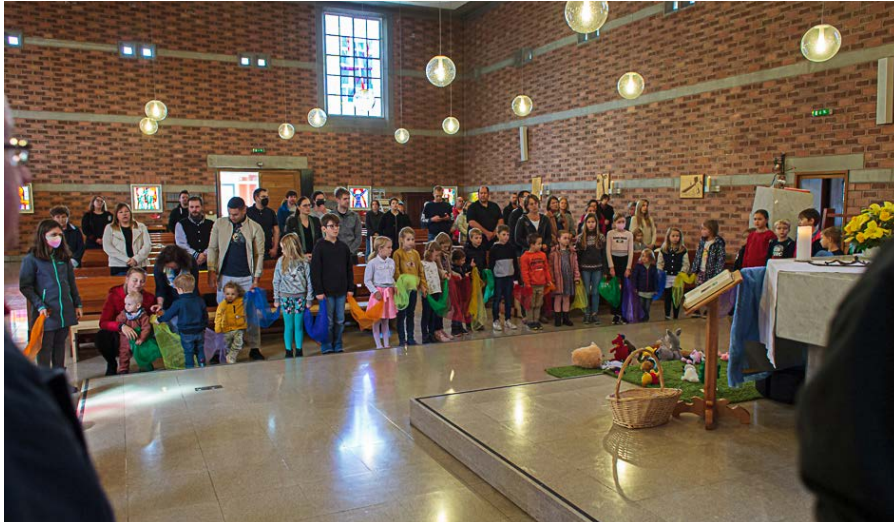
Kindermesse im Oktober zum Hl. Franziskus